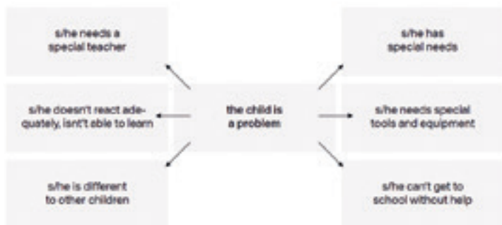
Figuur 1: Medisch model van verschillende onderwijsbehoeften. (Bron: Miles, 2000, geciteerd in Wiene, 2019, p. 9.)

vraag aan het kind: wat heb jij nodig om mee te kunnen doen? De tweede benadering begint bij de context, het onderwijssysteem. Deze begint met de vraag wat wij als volwassenen nodig hebben om de context zo te organiseren dat alle individuen mee kunnen doen en optimaal kunnen profiteren van ons aanbod. In Nederland nemen we doorgaans het individu als aanknopingspunt. Wat inclusief onderwijs dan is? Heel plastisch gesproken doe je alle plannen met ontwikkelingsperspectieven van leerlingen op een stapel, sla je er een